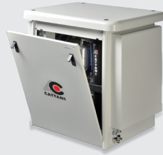
Carenatura insonorizzante -20 dB(A) ca. Soundproof cabinet - approx. 20 dB (A) L / W 840 mm P / D 700 mm A / H 887 mm

I modelli AC100 - AC200 - AC300 possono essere insonorizzati sia con le protezioni in plastica che con le carenatura. I modelli AC400 e AC600 possono essere insonorizzati solo con le protezioni in plastica. Con i modelli AC1800 e oltre è necessario insonorizzare l'ambiente.