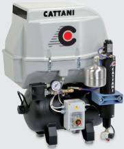
Protezione insonorizzante in plastica -10 dB(A) ca. Noise-reducing plastic cover - approx.10 dB (A)